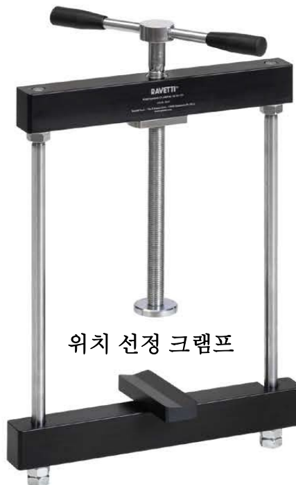
위치 선정 크램프