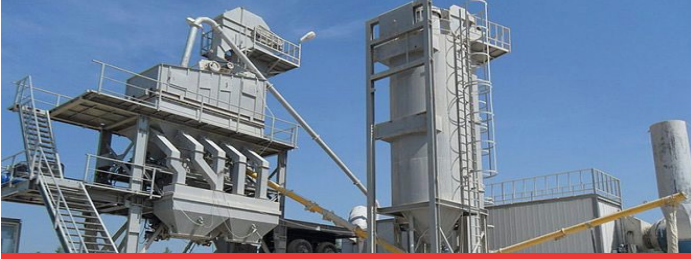
뜨거운 혼합 아스팔트