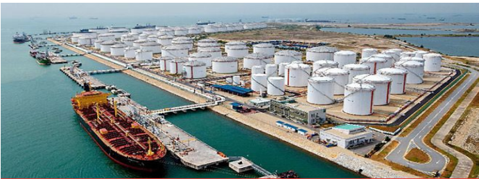
탱크 및 터미널