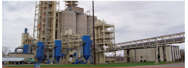
사료 및 곡물